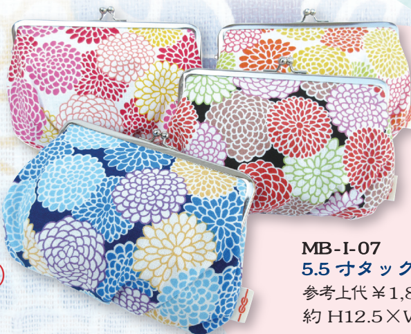
MB-I-07 5.5寸タックガマロポーチ 参考上代 ¥1,800(税別) 約 H12.5×W18.5cm