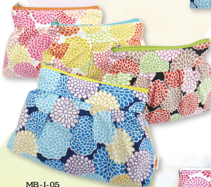
MB-I-05 ギャザーポーチ 参考上代 ¥1,200 (税別) 約 H15×W23×D3.5cm