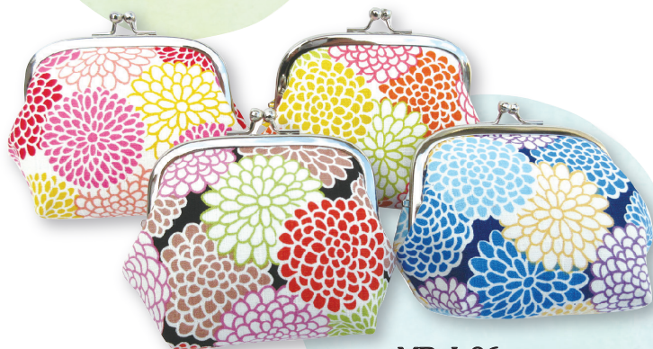
MB-I-06 3.5寸大角丸 参考上代 ¥1,200 (税別) 約 H9.5×W13×D6cm