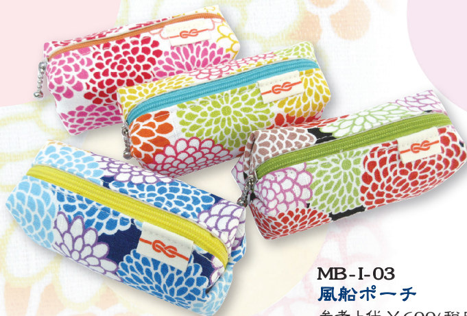
MB-I-03 風船ポーチ 参考上代 ¥600(税別) 約 H5×W10×D4cm