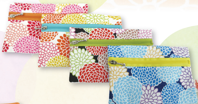
MB-I-04 ファスナー平ポーチ 参考上代 ¥700(税別) 約 H10.5×W15.5cm